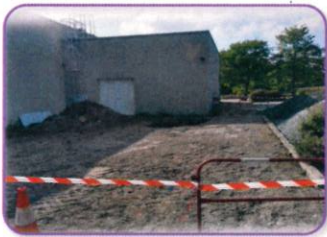
La réalisation de l'extension de la boulangerie