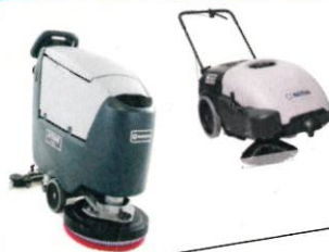
L'achat de matériel de nettoyage