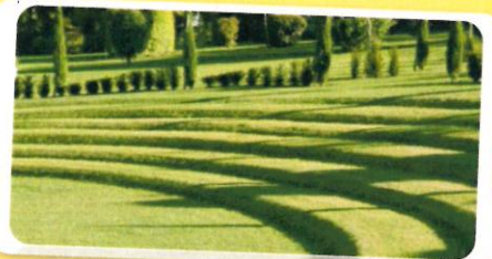
La création d'un théâtre de verdure