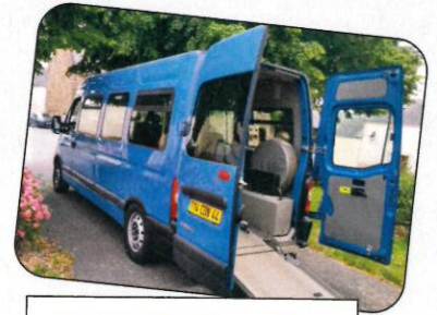
L'acquisition d'un véhicule PMR