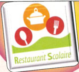
La poursuite du projet d'un restaurant scolaire