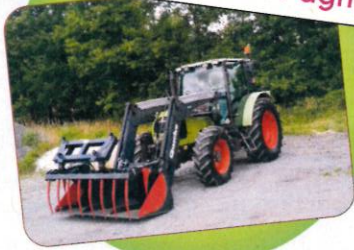
L'acquisition d'un tracteur agricole