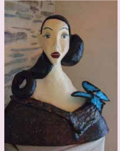
Oeuvre de Gaëlle PERROTIN

L'ensemble de l'équipe tient à remercier les propriétaires qui ont accueilli chez eux une ou un artiste.