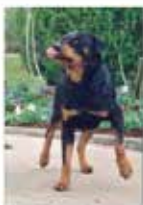
Divagation des animaux errants, agressifs, dangereux ou blessés