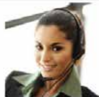
L'appel est enregistré par la SACPA qui déclenche l'intervention