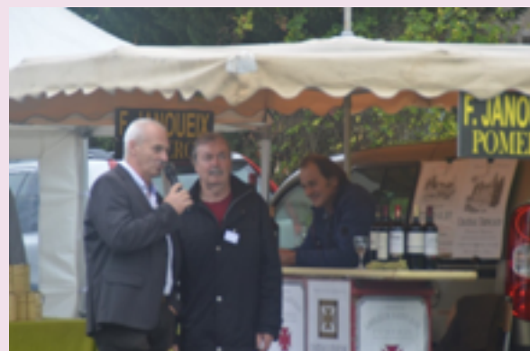
L'ouverture du marché par le président du comité des fêtes en présence du Maire.

Malgré une météo défavorable et un public clairsemé. Les 24 exposants présents sont repartis satisfaits et souhaitent revenir pour la 4 ème édition.