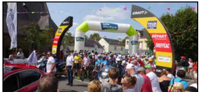
Toujours spectaculaire, le départ, en présence de Bernard Hinault, qui a remporté 5 fois le tour de France