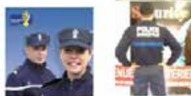
Les services habilités peuvent contacter nos services