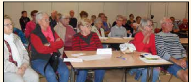
Un public intéressé et attentif