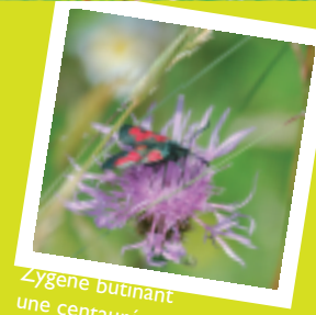
Zygène butinant une centaurée

Les fleurs de ces prairies sont le garde-manger d'une multitude d'insectes