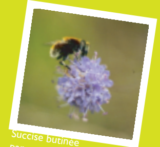
Succise butinée par une abeille

La Succise des prés ne pousse que dans les prairies humides et maigres. Le Damier pond ses oeufs sur les feuilles de la base de la plante qui nourriront la chenille. Après la nymphose (transformation de la chenille en papillon), l'adulte ne vit que quelques semaines.