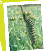
Chenille de Machaon