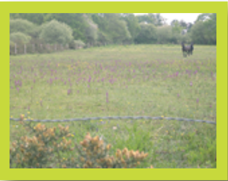
Prairie aux chevaux

La végétation est différente selon le mode d'entretien : par pâturage ou par fauche (au total encore plus de diversité)