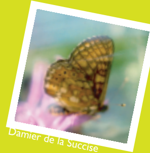
Damier de la Succise

La Succise des prés ne pousse que dans les prairies humides et maigres. Le Damier pond ses oeufs sur les feuilles de la base de la plante qui nourriront la chenille. Après la nymphose (transformation de la chenille en papillon), l'adulte ne vit que quelques semaines.